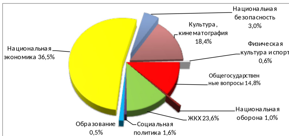
Рис. 2. Структура расходов бюджета Кировского сельского поселения за 2025 год

Из диаграммы, представленной на рисунке 2, видно, что наибольший удельный вес в общих расходах поселения занимают расходы по разделу 0400 «Национальная экономика» - 36,5%, а наименьший - по разделу 1100 «Образование» - 0,5%.